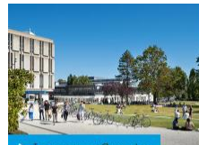
➤ Le campus Carreire

Situé au sud-ouest du centre de Bordeaux, le campus Montaigne-Montesquieu à Pessac est desservi par la ligne B du tramway. Il accueille les sciences humaines et sociales.