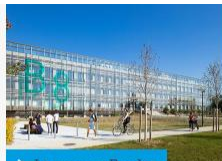
➤ Le campus Bordes

Le campus Peixotto, situé à l'est du domaine universitaire, accueille notamment une partie du secteur sciences et technologies (bâtiments A).