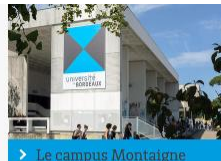
➤ Le campus Montaigne Montesquieu

Le campus Bordes, situé à l'est du domaine universitaire, accueille notamment l'autre partie du secteur sciences et technologies (bâtiments B).