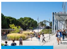
➤ Le campus Peixotto

Le présent marché s'exécute sur l'ensemble des sites de l'université situés sur le département de la Gironde.