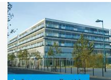
➤ Le campus Bastide

Le campus Victoire, qui inclut également le Pôle juridique et judiciaire de Pey Berland, est le lieu d'études et de recherche des sciences de l'Homme.