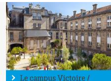
➤ Le campus Victoire / centre ville

Le campus de Carreire, jouxtant le CHU de Bordeaux, accueille la plupart des étudiants de la filière santé et biologie, mais également de nombreux laboratoires de recherche.